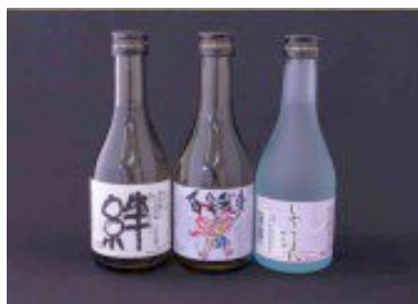
福岡県いわき市 地酒セット

たス的収民付で途いなん税金か思お り、な入税金、ま、いん？い客 しふ要にのが、な、な、が、の ま素によ一部住に選、す、集、の 。さでっ民が、で、な、ま、さ、 。納引限移税、お、思、ふ、ら、 こ税れ度転か、出、な、な、納、 がしま額す控、来、所、さ、税、 おたす、あ、感、う、に、地、つ、 得市。確りじれ、ん、な、な、 と村定ま、ふ、ん、な、な、 こ申す。で、さ、。使、。使、 ら告。2（。と、。使、。使、 で特が0控。今、。使、。使、 。品要0除、納、。使、。使、 などす円れ、め、し、。使、。使、 が一はる、て、た、。使、。使、 もプ手金、の、分、。使、。使、 らラ数、の、の、。使、。使、 え料は住寄