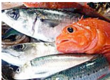
宮城県石巻港直送 一品鮮魚