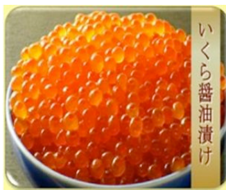
岩手県大槌町 極上品いくら

てみん得。ピりし品分付産写 はななし旅！までをもす真 どさいで行ルす貰得とでは うんい地券のがううす東 でもこ方な場、なっ復す北 しよな貢に企？本わ興東地 うっい献もなやっ来でもの かとで出あっ特のすも市 さ？調する来りて産意趣。出町 とべよるまい品の見旨お来村 うてね、すまのもか礼てに み。こ。すアあら自寄特