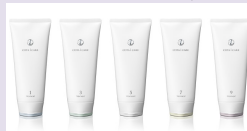
紫外線防止効果のあるモノ i careシリーズ各種 フェアルシアシリーズ各種

紫外線対策は結局「当たらない」ってのがメインにはなりますが、効果の持続と重ね付けのベタつきへの不安感はこの感じで少しは解消できるのではないかと思います。